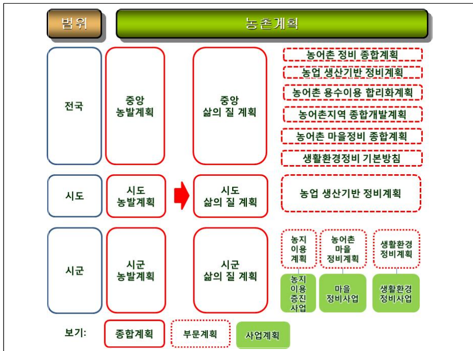
그림 1 | 농촌계획의 체계